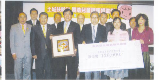
Weaving PPI以本社名義捐助土城國小、屏東來義國小讀報教育公益活動 2007.12.05