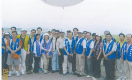
中天電視台「發現新台灣」報導9月15日 扶輪環保地球日活動