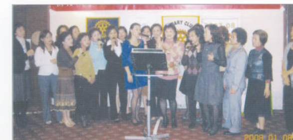
邀請社友及賓眷參加爐邊會議