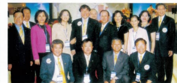
參加3490地區第十八屆地區年會 榮獲廿項獎項 2008.04.19