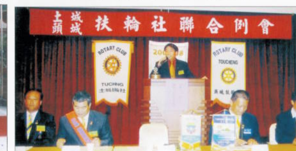
每週有三分鐘扶輪知識講解