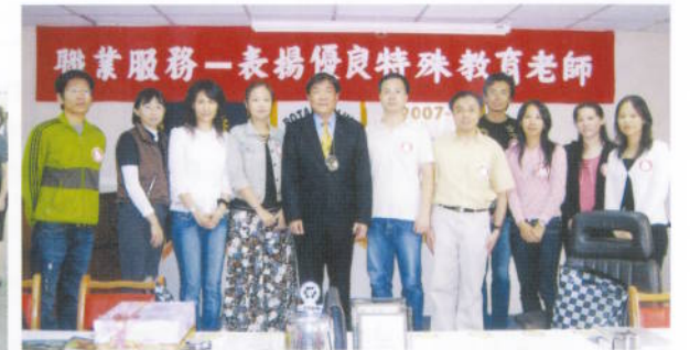
表揚土城地區特殊教育優良老師