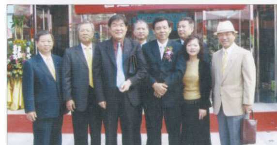
Link社友經營的鴻松精密科技公司營運總部開幕