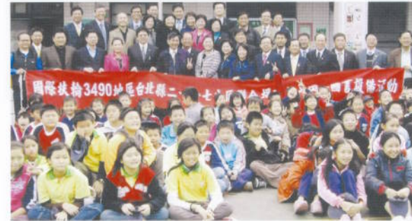
捐贈三峽大成國小「電腦伺服器暨借書軟體系統設備」